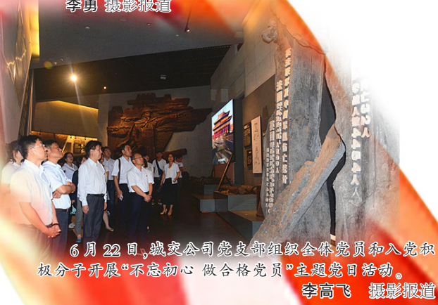
6月22日，城发公司党支部组织全体党员和入党积极分子开展“不忘初心 做合格党员”主题党日活动。