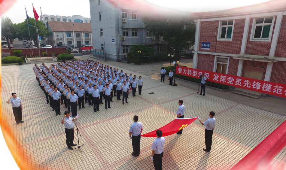
6月29日，一公司举行“纪念建党96周年 重温入党誓词”仪式。

一次重温“入党申请书”的活动，把广大党员同志从现实生活中拉回了入党宣言的回忆里。“温故而知新”，回顾是为了更好的进步。当“两学一做”活动开展之时，学习已经成为了主旋律。学党章、学党规、学习总书记重要讲话的同时，也要学自己、学过去。以史为鉴，自我提升，有助于更深刻地理解合格共产党员的真正内涵。