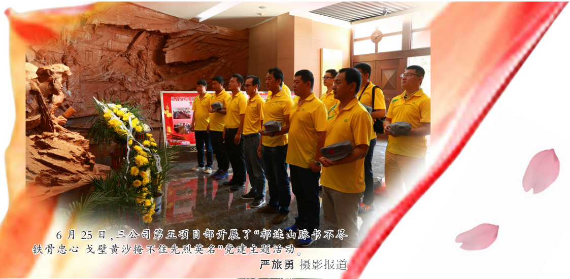
6月25日，三公司第五项目部开展了“缅怀先烈 铁骨忠心 戈壁黄沙掩不住先烈英名”党建主题活动。