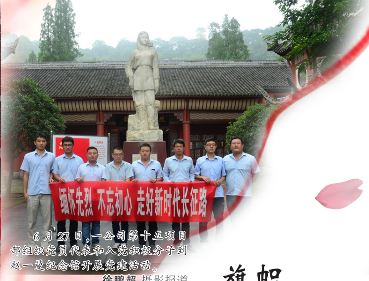
6月27日，一公司第十五项目部组织党员代表和入党积极分子到七一纪念馆开展党建活动。徐鹏超 摄影报道