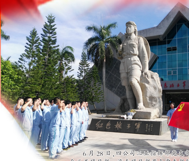
6月28日，四公司三亚指挥部党支部联合三亚项目部、海南项目部两个党支部到红色娘子军纪念馆开展党建活动。

关键时，每个党员 都是一面旗帜 无论在北国还是南方 危难时，每个党员 都是铁壁铜墙 无论在大漠还是海港 困难时，每个党员 都会迎头赶上 无论在远海还是边疆 冲锋时，每个党员 都是热血沸腾 无论在故乡还是他乡