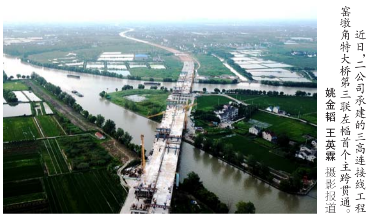
近日，二公司承建的三高速连接工程霍墩角特大桥第三联左幅首个主跨贯通。