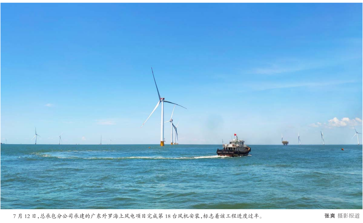
7月12日,总承包分公司承建的广东外罗海上风电项目完成第18台风机安装,标志着该工程进度过半。

7月16日至22日,公司举行新员工入职培训,来自各单位的794名员工参加培训。本次培训为公司的入职培训中时间最长、规模最大、实用性最强,授课内容涵盖企业文化、发展战略、工程技术管理等多项内容。