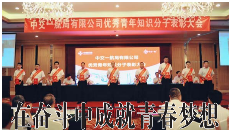
在奋斗中成就青春梦想

会议部署了《总部党委“不忘初心、牢记使命”主题教育实施方案》,对目标任务进行了解读,并从七个方面进行了重点工作安排。