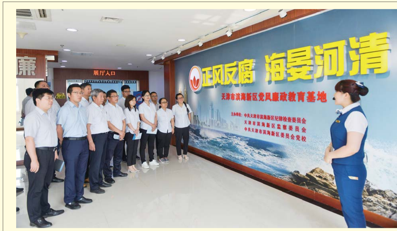
「月5日，一公司组织总部党员干部到滨海新区党风廉政教育基地开展廉政主题教育。」

积极开展预防教育主题月活动，通过开展“亲情寄语”“廉洁家书征集评选”“廉洁诗词诵读比赛”等活动，营造浓厚的廉洁氛围。创新预防教育形式，让“警示教育”成为党员领导干部的必修课。启动“以案边案例说法明纪”典型案例宣讲活动，让“廉洁”镌刻在每一位职工心里。截至目前，二公司已开展宣讲18场次，党员领导干部、重点岗位人员550余人参加。深入推进廉洁文化示范点创建活动，选树典型，推广经验，不断开创廉洁文化建设新局面。