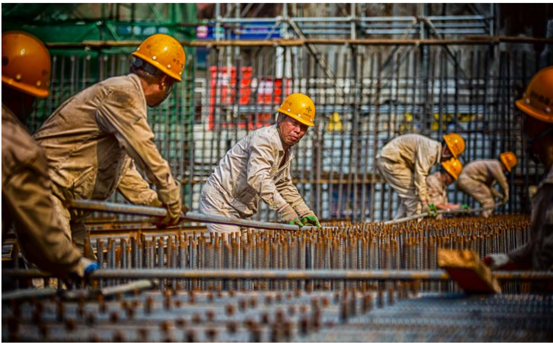
齐心协力