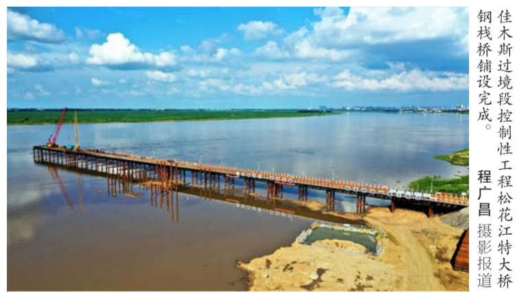
7月25日，三公司承建的鹤大高速佳木斯过境段控制性工程松花江特大桥钢栈桥铺设完成。