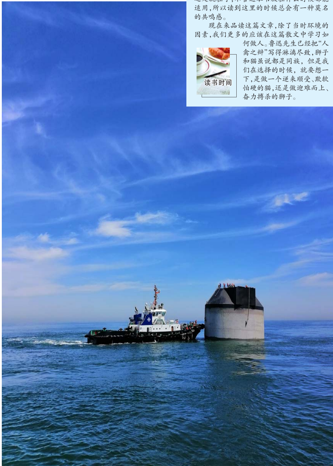
海天之歌