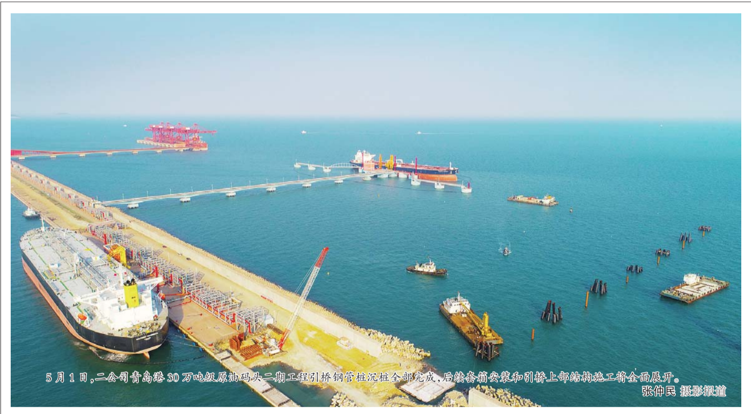
5月1日,二公司青岛港30万吨级原码头二期工程引桥钢管桩沉桩全部完成,后续套箱安装和引桥上部结构施工将全面展开。

下一步,项目部将全力组织支流水系治理工程、暗涵小河汉整治工程、正本清源改造工程施工,确保项目整体工作推进力度和实效,奋力冲刺年底消除黑臭目标。