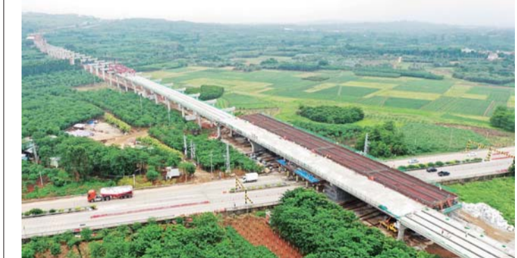
5月8日,广东玉湛高速公路疏港大道墩柱、盖梁施工任务全部完成。