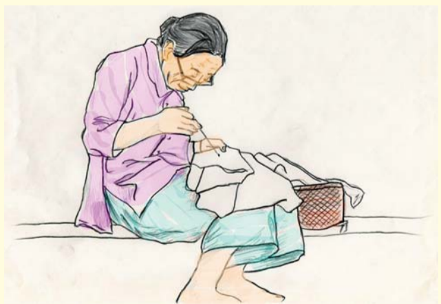
临行密密缝 孙敬人 绘