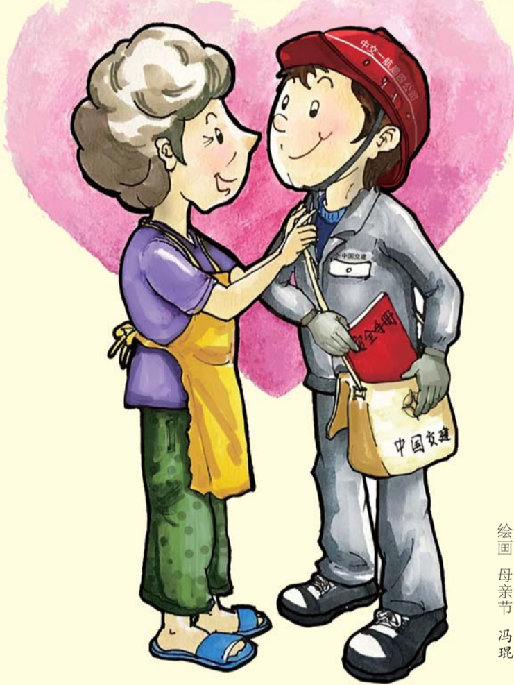
绘画 母亲节 冯琨