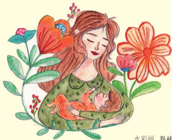
水彩画 郭楠 绘