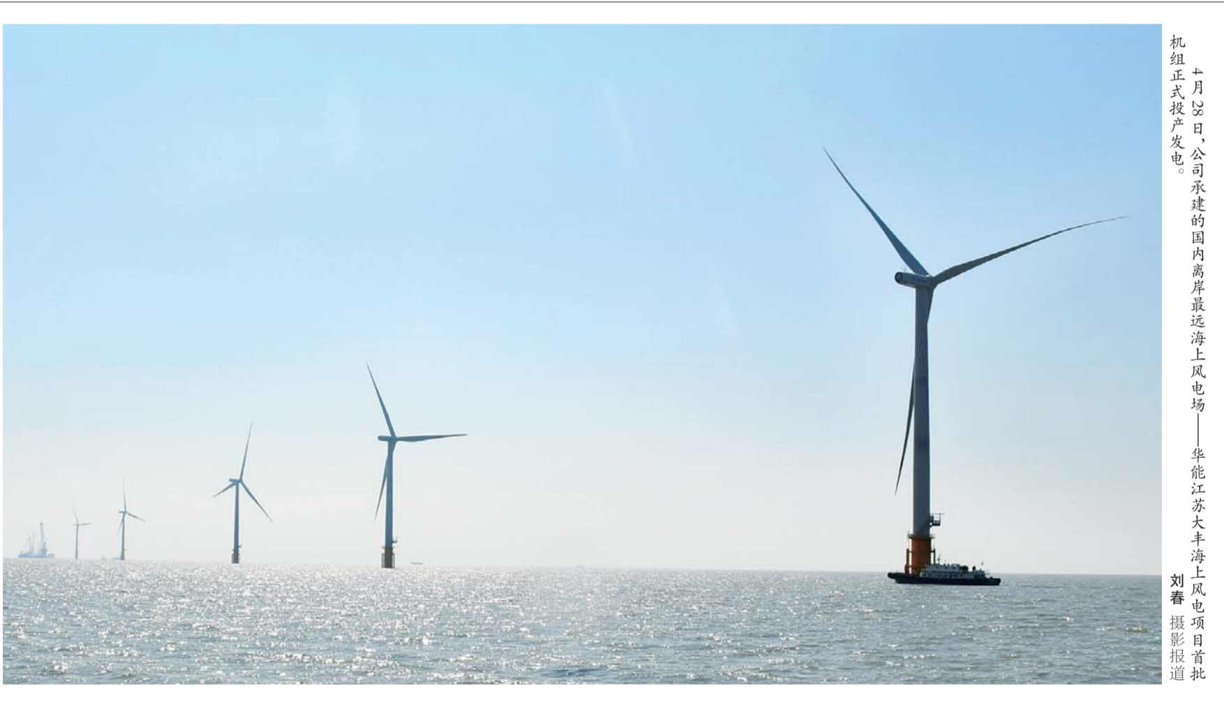
1月26日,公司承建的国内离岸最远海上风电场——华能江苏大丰海上风电项目首批机组正式投产发电。

惟改革者进,惟创新者强。公司此次引入外脑开展管理咨询,聚焦改革发展目标,目的就是聚合专业力量,革除传统管理中的弊端,进一步梳理公司战略、组织、绩效等各方面管理内容,提升管理效率。公司各级干部员工要在管理咨询开展过程中,全力配合工作、积极建言献策,为企业高质量发展贡献力量。