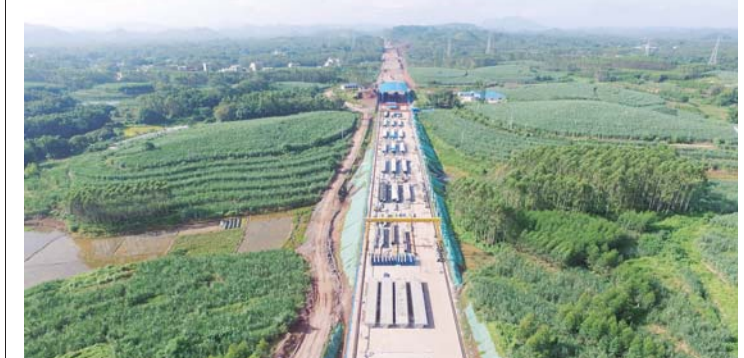
4月29日,广西玉湛一工区管段内1号预制场428根预制梁预制任务全部完成,成为全线三个工区首个完成箱梁预制任务的预制场。