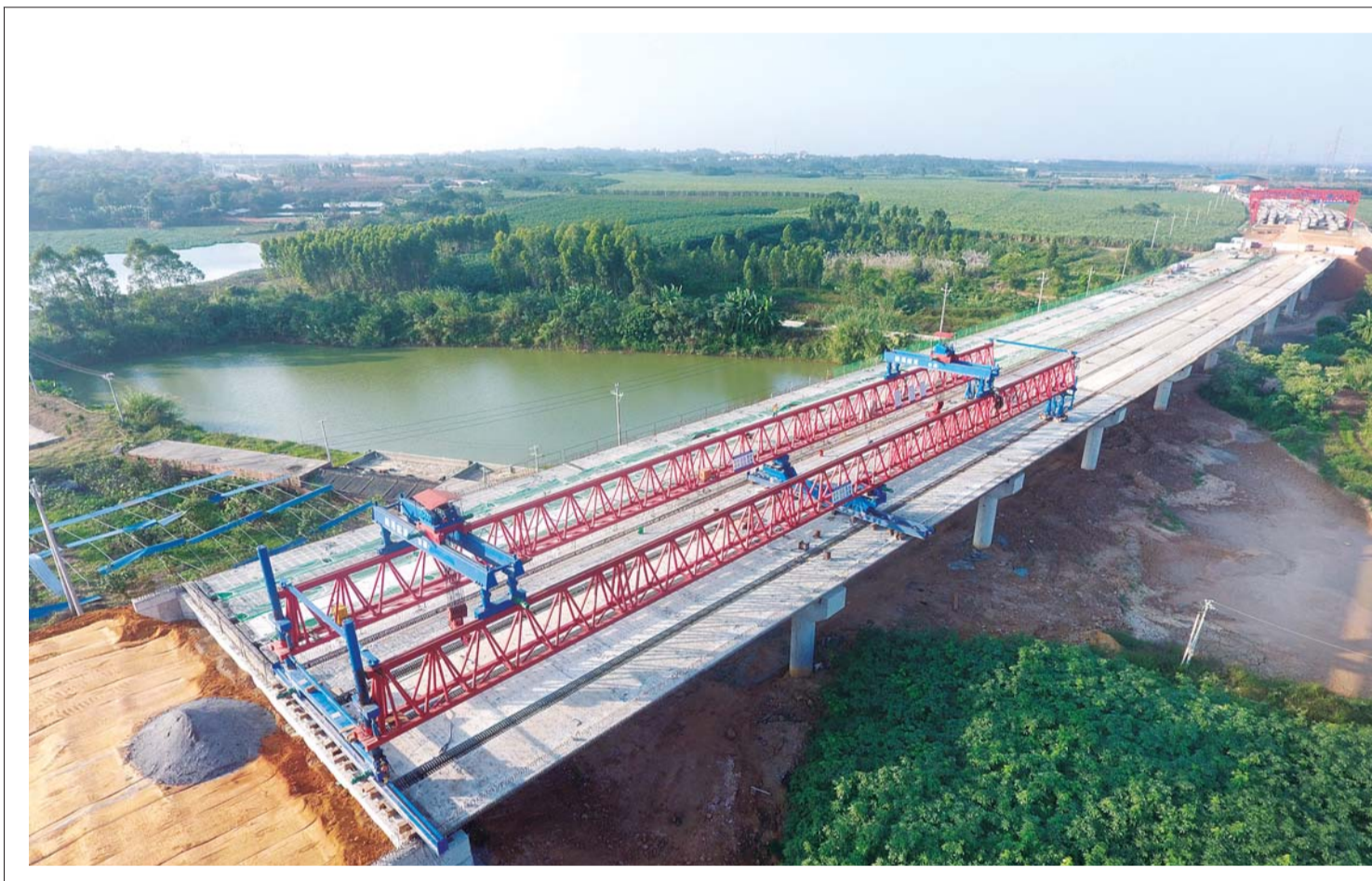
二月12日,公司承建的玉湛高速公路广东段大鵬大桥箱梁架设完成,标志着该桥全幅贯通。

“可不是么,朱大夫还算是挺称职的,算是帮半潜驳甲板去了‘病根’啊!”小董乐呵呵地夸赞道。