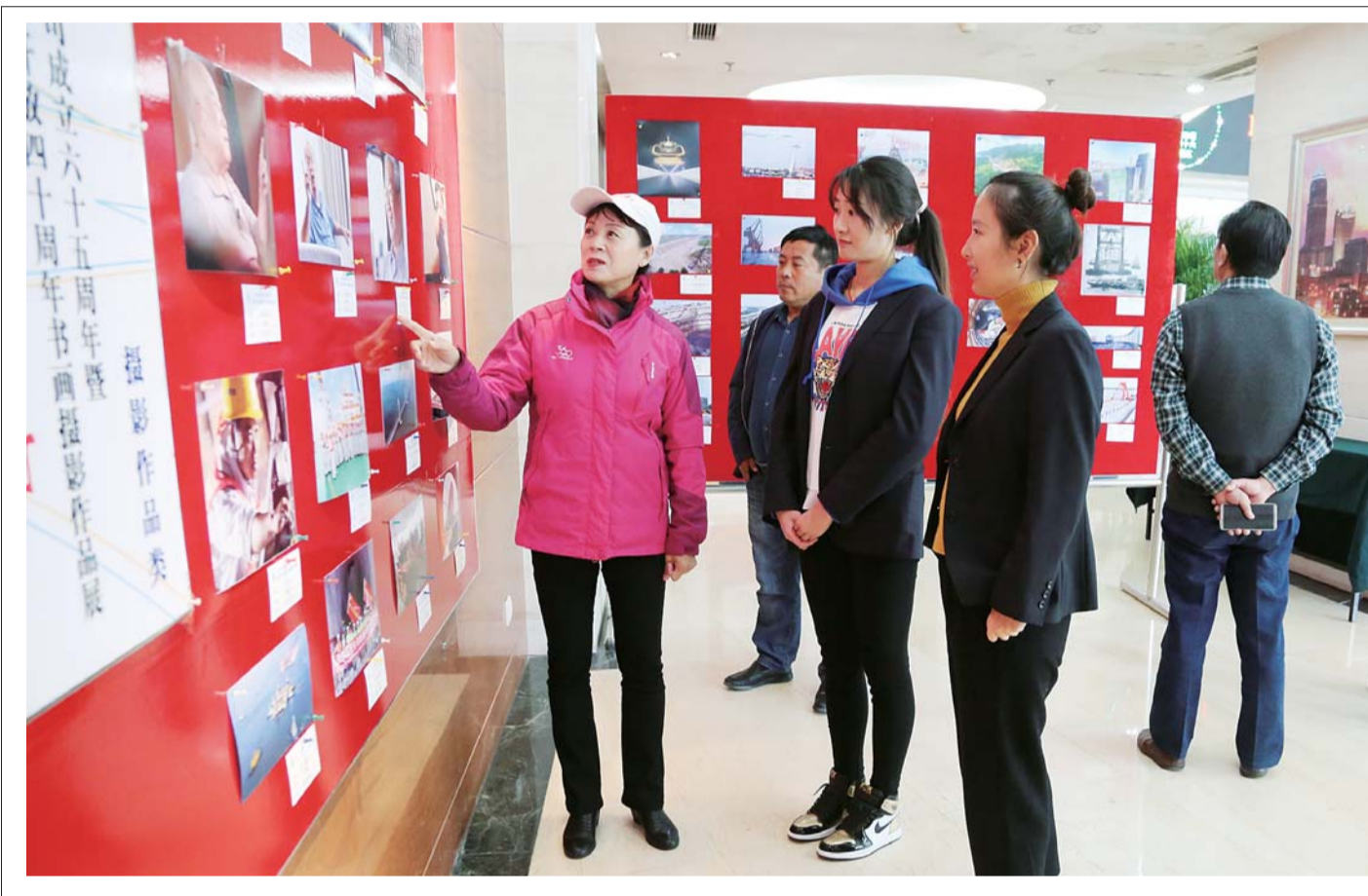
近日,二公司举办「不忘初心,砥砺前行」纪念改革开放40周年书画摄影作品展,共展出了广大职工书画家以及退休老职工书画家们创作的约100幅书画摄影作品,展示了改革开放40年来二公司的发展足迹。图为二公司退休职工书画家给参观展览的职工讲解作品背后的故事。

港务公司副总经理马海深在抢险抢修总结会上指出,安装公司在T3-5机房抢险抢修过程中顾全大局、行动迅速、全力支持,组织了大量的人力、物力投入到抢险当中,为此次抢险抢修工作作出了突出贡献。