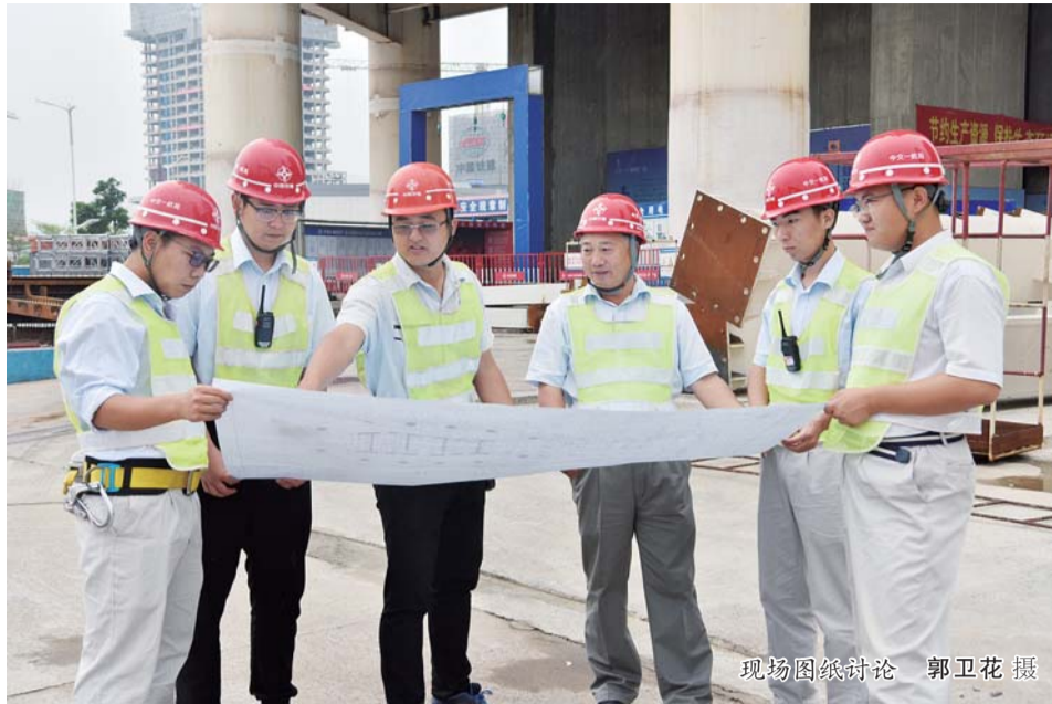
现场图纸讨论

钢骨柱是加强层施工中最常用的钢构件，原来的有24根独立的钢骨柱，20根连梁，采用单独吊装的方式，需要吊装44次，既浪费了人工，效率也不高。把装配式理念引入之后，在地面通过螺栓对H形的钢骨柱进行临时连接，然后吊装在指定位置。这样一来，既然增加了吊