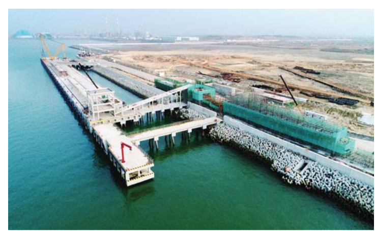
近日,一公司施工的中科合资广东炼化一体化项目顺岸码头附属建筑工程 TH1 转运站、ZQ2 栈桥主体结构完工。