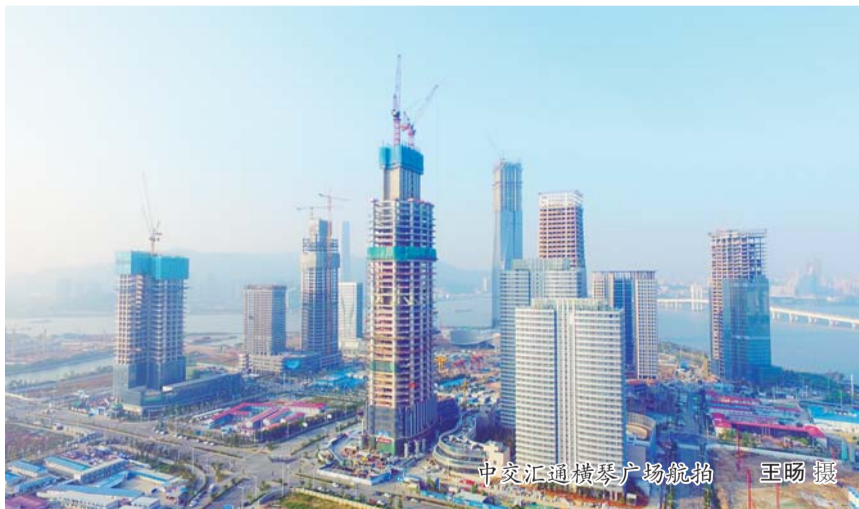
中交汇通横琴广场航拍

“山竹”登陆后，由于前期准备得当，项目部将损失降到了最低。台风过后，项目部第一时间组织管理人员到现场展开灾后统计，排查安全隐患，邀请专家对塔吊等大型设备进行运行情况的检测，以确保工作时不会出现问题。最终，项目部凭借高效组织，实现了“一天恢复现场生活，三天恢复现场生产”，业主赞誉：真是一支能打硬仗的“铁军”。