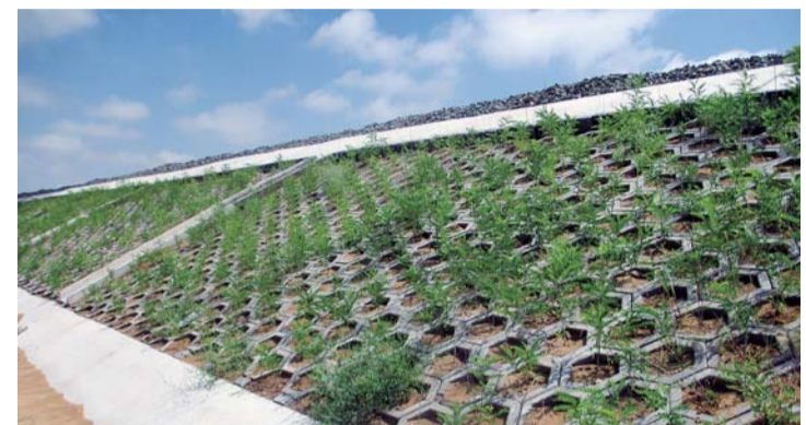
11月15日,豪华铁路MHTJ-1标段三工区绿色防护工程施工完成。该工程施工内容为路基拱型骨架护坡及空心块护坡边坡范围内栽植灌木,灌木选取抗旱耐活的紫穗槐与沙柳,设计栽植灌木4784.94千株。