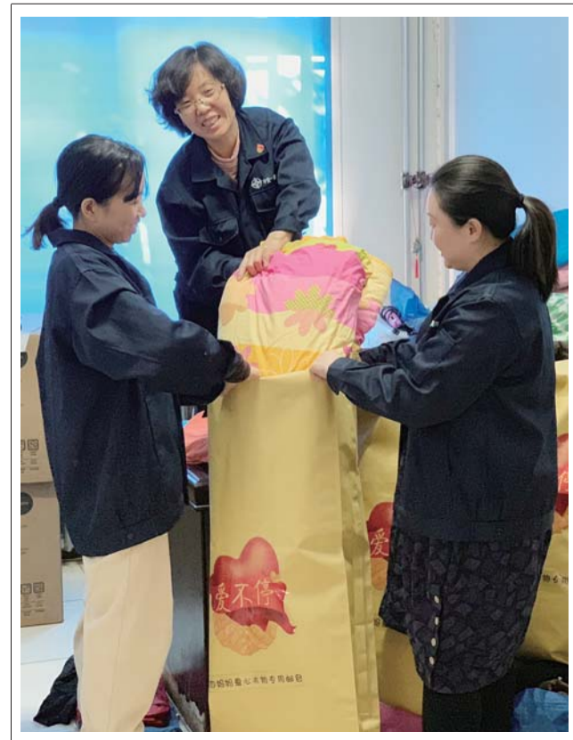
「航四妈妈群」连续第九年启动“爱心衣柜”活动,为西藏贫困学生及家庭捐赠过冬衣物。图为志愿者在邮寄爱心包裹。

《最美的青春》中“牢记使命、艰苦创业、绿色发展”的塞罕坝精神激励着新时代的青年人。当前企业正处于改革创新、高质量发展中,同样需要我们每一名青年员工拿出钉钉子精神,立足本职岗位,一步一个脚印,脚踏实地、拼搏奉献,不负岁月、不负时光,牢记初心,用奋斗的青春书写自己的价值。