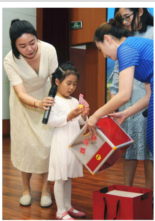
9月16日,五公司邀请部分在秦皇岛的海外项目职工及家属参加“双节”联谊,增进家属间相互联系和对海外职工生活的了解。图为海外项目职工家属参与现场抽奖。