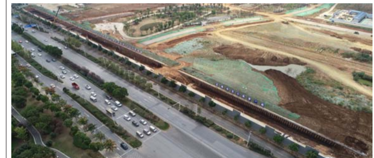
9月19日,三公司承建的武汉光谷中心城综合管廊工程高新大道路段正式开工建设。