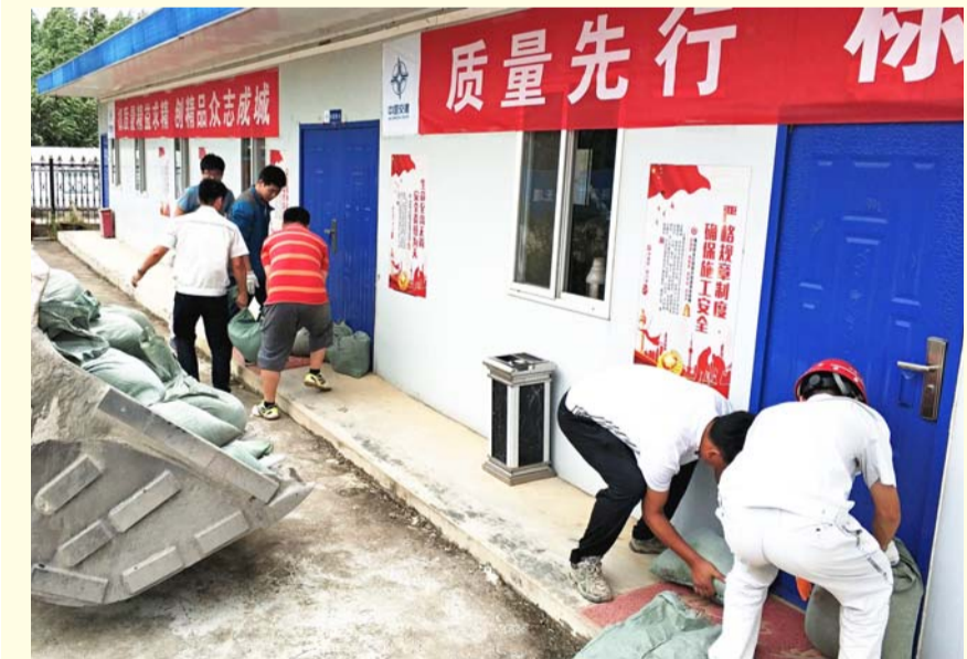
封堵加固项目部门窗

编者按:今年第22号台风“山竹”的中心于9月16日17时前后在广东沿海登陆,成年来登陆我国最强台风。公司在华南地区的多个项目按照防台应急预案,提前做好防护措施,组织人员撤离,有效保障人员安全,减少了财产损失,为灾后迅速恢复生产创造了条件。