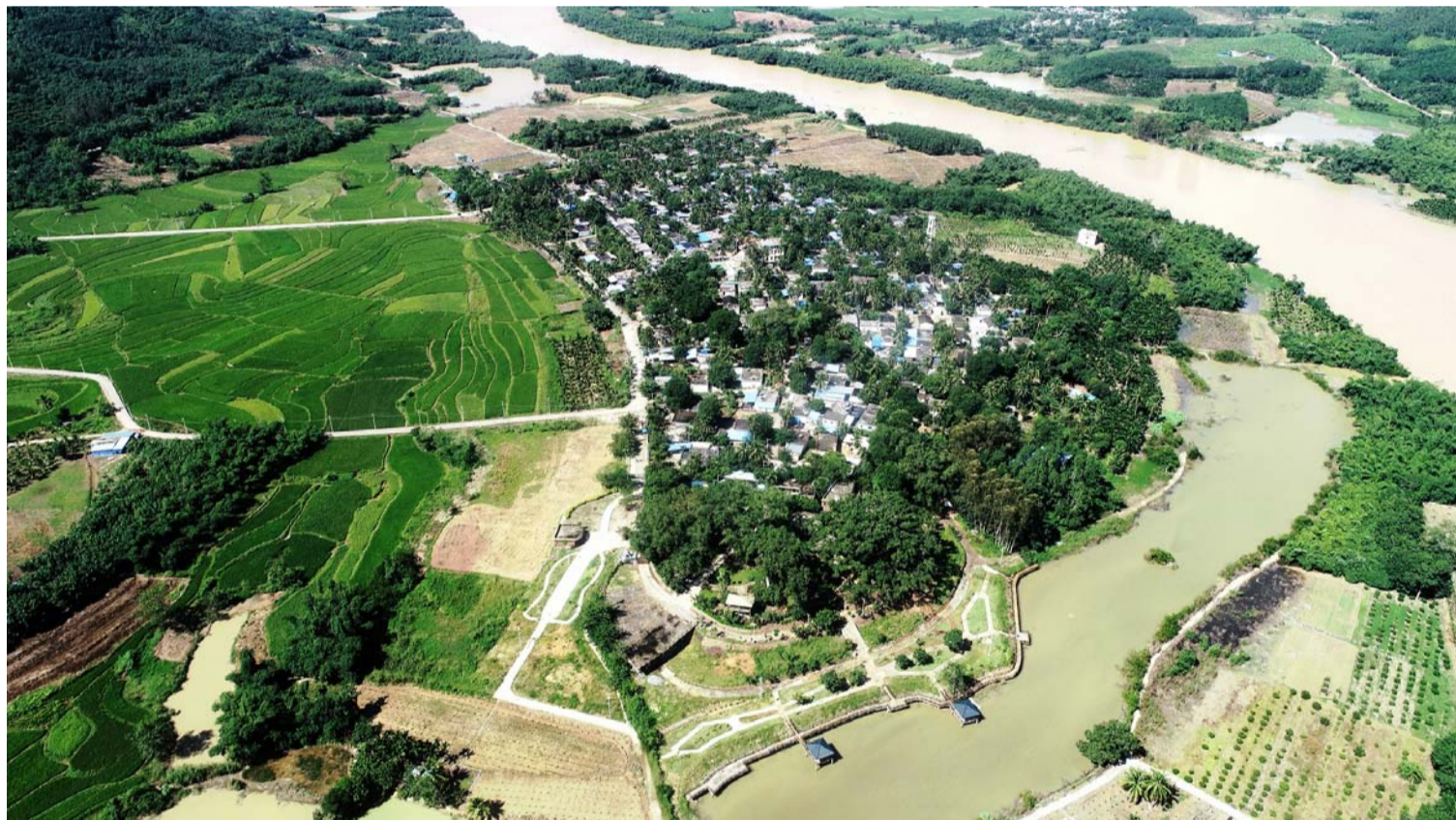
“绿水青山就是金山银山。”9月15日,五公司海南项目部承建的一航局首个美丽乡村建设工程——乐东县2017年友谊村等十二个美丽乡村建设工程顺利通过验收。

据悉,飞行区西一、西二跑道每条长3800米,四公司承建的跑道中间部分每条长1377.5米。施工中,项目部着力打造“数字化”智慧工地和“绿色”环保型工地,圆满完成了节点任务,得到各方肯定。