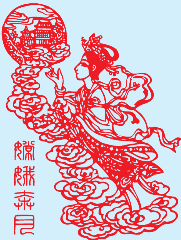
剪纸 嫦娥奔月 马文英

那一晚,挂断妹妹的电话,抬头看着窗外,远处的霓虹灯一片璀璨,而天上的那轮明月,似乎沁着父母最慈祥的暖。