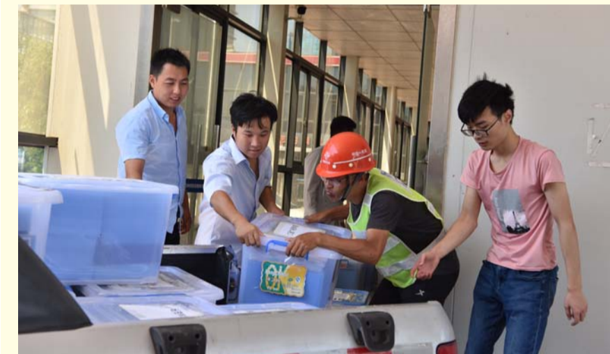
转移重要工程资料至安全区域