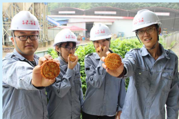
看,我们的“中交月饼”