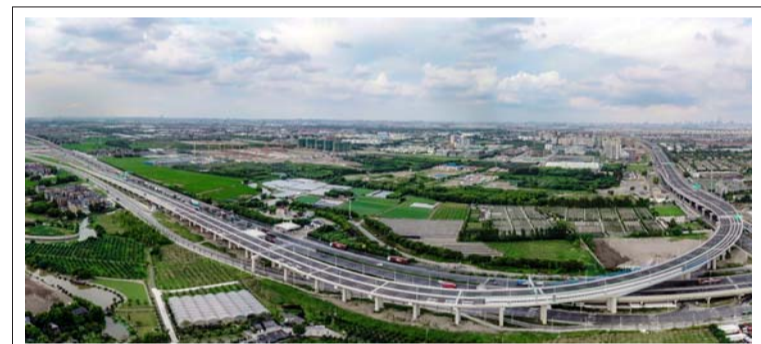
9月21日,一公司参建的中国首届国际进口博览会配套工程——S26公路入城段顺利通车。