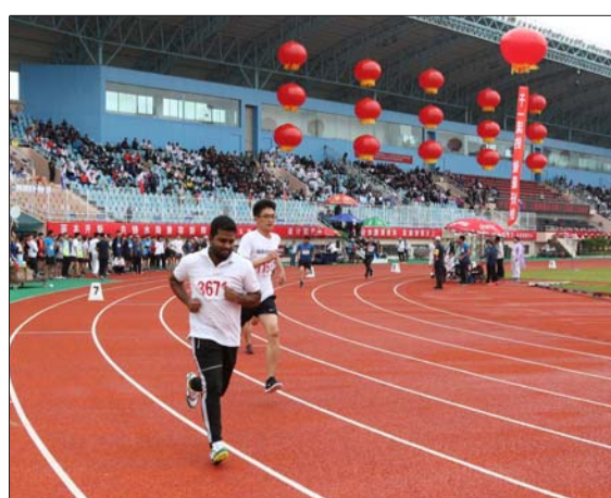
9月19日,时隔七年,二公司第十五届职工运动会在青岛举行。本次运动会首次邀请5名优秀外籍员工参加,增添国际化元素,促进外籍员工融入企业,助推公司海外发展。