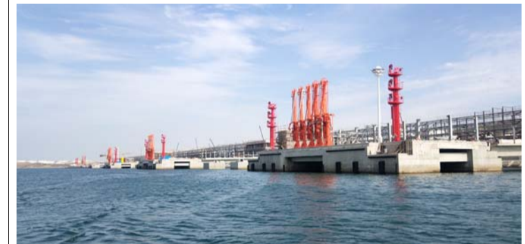
9月14日,三公司长兴岛项目部承建的恒力石化(大连)108号-113号液体散货泊位工程主体施工全部完成。