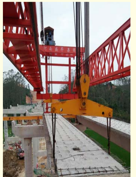
架桥机与梁体连接固定

陆上后勤保障小组同时张罗着后勤物资的采购和准备,避难场所的选择,每一个细节做不到位,都会引起群体事件。“早餐有面包、牛奶、卤蛋和火腿。”早上七点不到,后勤保障小组成员就到了安置点,分发着防台物资。为了保障台风期间员工吃得饱、睡