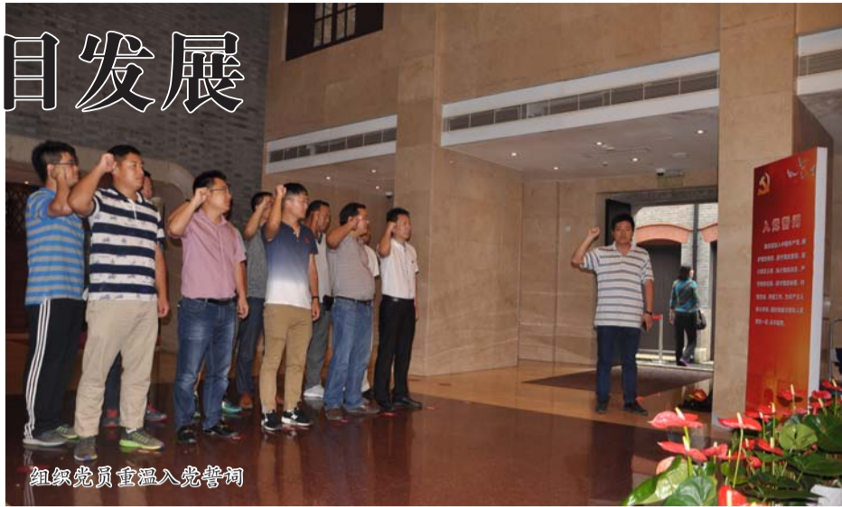
组织党员重温入党誓词

湖州项目部主要承担公司在湖州市南浔区投资项目施工，项目部党支部在上级党委领导下，立足项目实际，构筑坚强堡垒，围绕项目“经营、履约、创效”发挥引领和保障作用。