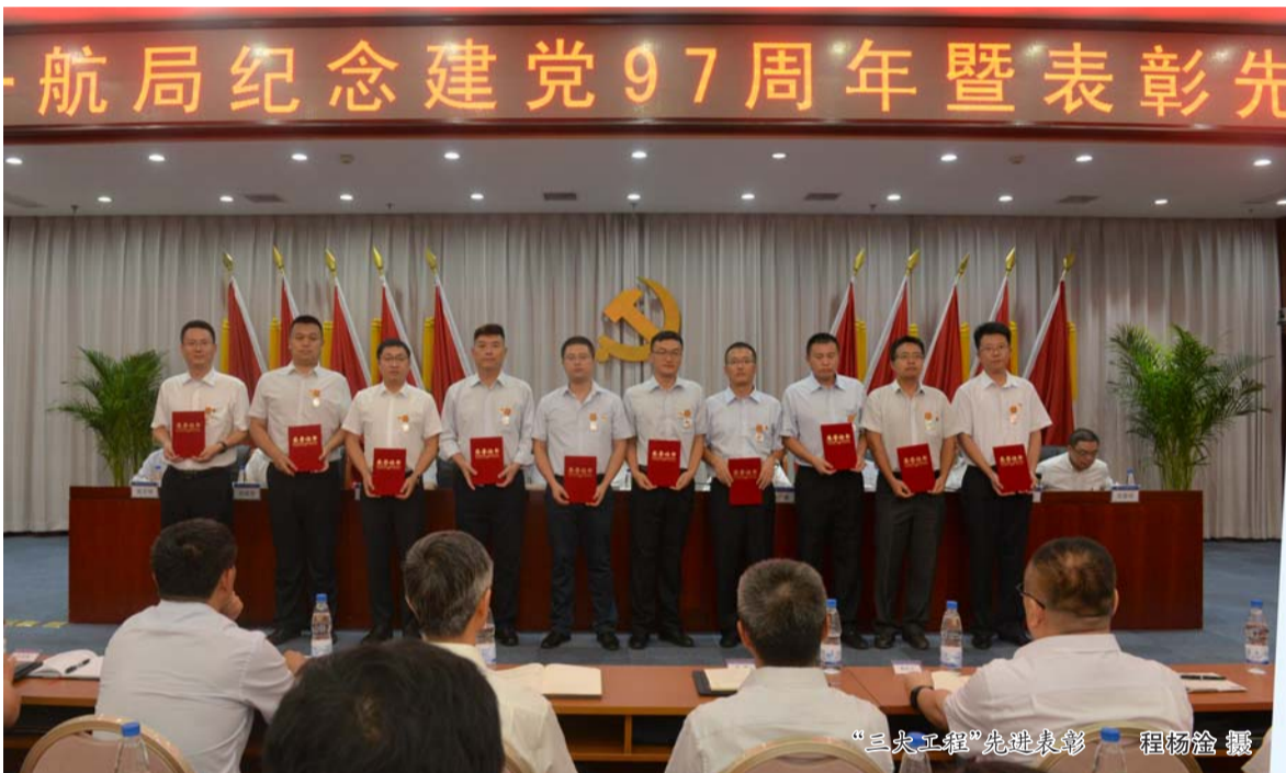
“三大工程”先进表彰

公司所属各单位党政主要负责人、总部部门负责人和受表彰的先进集体、先进个人、部分党员代表及新党员代表参加了会议。