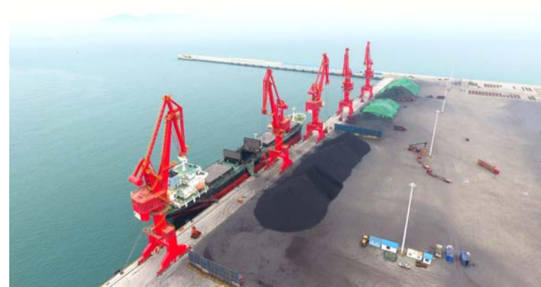
近日,浙海102号散煤运输船靠泊北良稻谷转运设施通运码头卸货,标志着三公司承建的北良稻谷转运设施项目通运泊位正式投入运营。