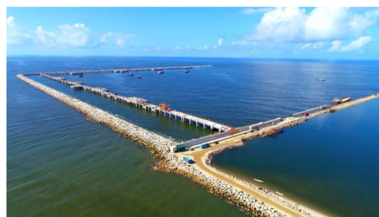
近日,五公司第三项目部负责的中委合资广东石化产品码头工程高桩泊位横梁浇筑完成。该工程包括9座引桥、8座工作平台,码头岸线总长1.8公里。

时代在发展,安全管理的理念也要与时俱进。我们要有创新的理念,真正实现安全管理由“墙化”变成“强化”,由“人人管安全”变成“人人要安全”、“安全为人人”,最终实现项目管理的本质安全。