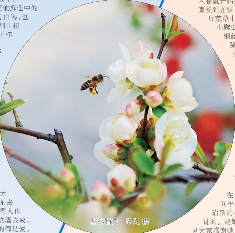
山林情思

“用手搬的!”“赵姐摊开两只手,笑道,“一开始还打着伞,后来嫌慢,干脆冒着大雨干完了。”