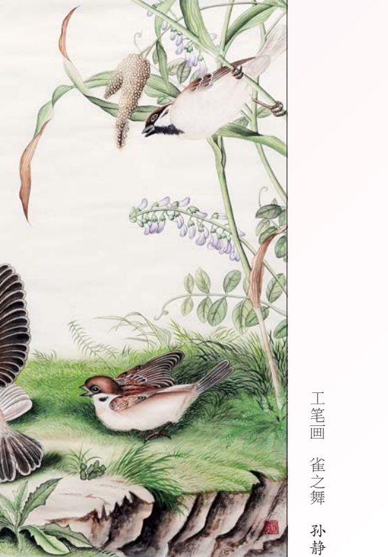
工笔画 崔之舞 孙静