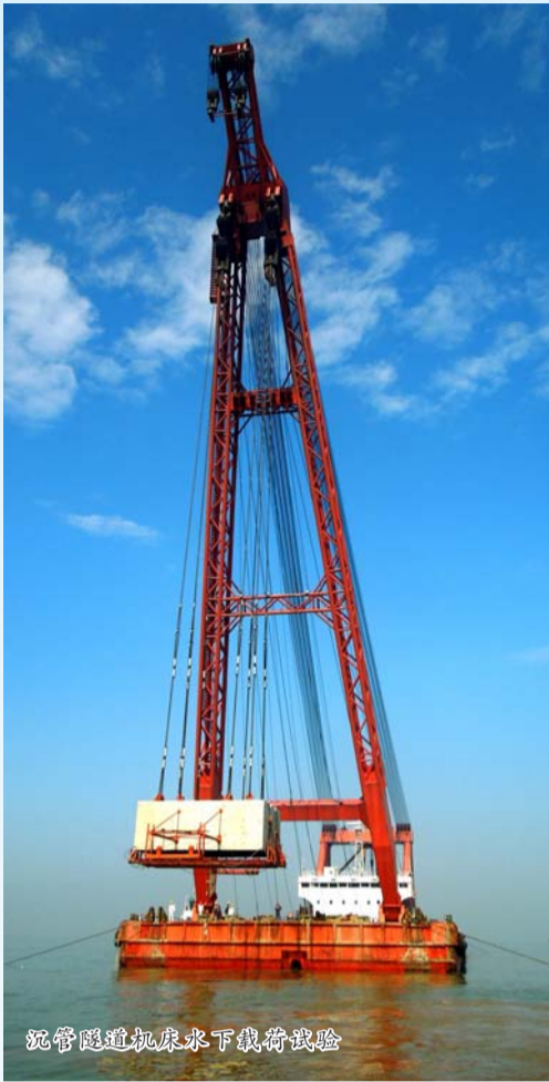
沉管隧道机床下水载荷试验

早晨8:30,往来通勤的接驳船只陆续停靠在港珠澳大桥西人工岛救援码头旁,这个只有半个足球场大的码头,是大桥建设者每天进入施工现场的“门户”,也是我国兴建的第一座外海深水重力式码头。