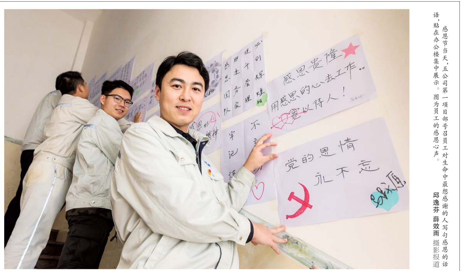
语,贴在办公楼集中展示。图为员工的感恩心声。