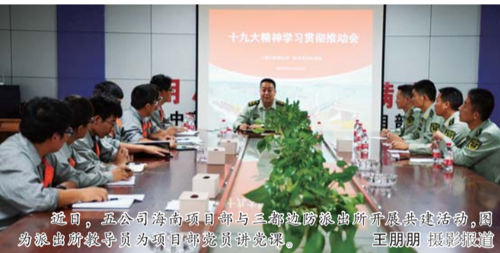
通过,五公司海南项目部与三都边防派出所开展共建活动,图为边防所教导员为项目部党员讲党课。

今年,是四公司和塘沽检察院联合开展的“企检共建项目”活动的第十一个年头。恰逢党的十九大,张连军检察官的专题讲座围绕党的十九大报告,回顾了十八大以来正风肃纪的各项成就,阐述了十九大关于全面从严治党的战略部署,重点就“如何预防职务犯罪”,通过传达文件精神、讲述真实案例、谈论工作体悟等形式,面向与会党员干部进行了深入浅出地讲解。