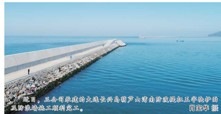
近日,三公司承建的大连长兴岛葫芦岛湾南防波堤扭王字块护面及防浪墙施工顺利完工。

兼顾的基础上,相继克服台风、季风天气影响及施工现场距海岸长达70公里、技术工艺复杂等不利因素,抢抓施工窗口期,精心组织,首次在风电领域成功使用导管架工艺以及用振动锤与冲击锤相结合的沉桩工艺,为今后海上风电项目积累了施工经验。