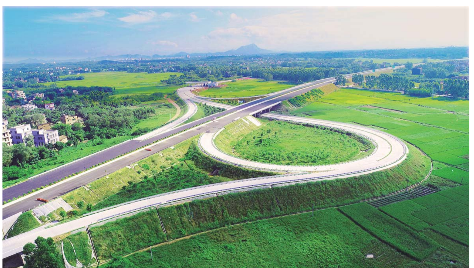
近日,一公司第三项目部参建的云湛高速公路主体工程全部完工。据悉,一公司云湛高速公路TJ22合同段共13.47公里,主要包括19座桥梁、63座涵洞及通道等施工任务。

“正能量”的背后,当地百姓注意到,在这些“最美丽的人”的努力下,供热管线一天天地以看得见的速度被逐渐拉长。11月8日,集中供热8.1公里长输管线全部贯通,薛区长激动地说道:“你们这样的队伍能打硬仗,值得信赖!”