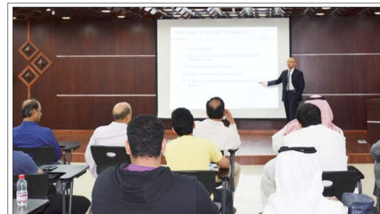
近日,二公司中东分公司与沙特朱拜勒大学商学院,联合举办了一场以中国文化和经济发展为主题的演讲。中国文化走进沙特课堂,吸引了近百名教授和学生聆听参与。葛东鑫 摄影报道

水运交通优质工程奖是我国水运建设行业工程质量评选的最高奖项。2016至2017年度共计获奖项目30项,公司获奖11项,占全行业的三分之一。