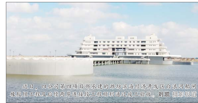
近日,四公司第四项目部承建的渤海湾经济开发区白浪河船闸橡胶坝工程及后续两岸连接段工程顺利通过竣工验收。